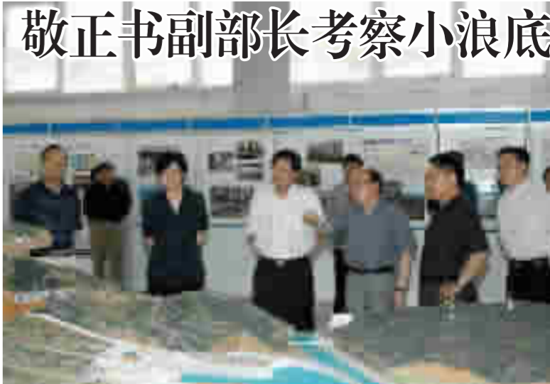
敬正书副部长考察小浪底